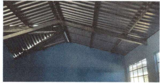
Foto 2: Estructura de techo, sustitución de soporte de madera por metal