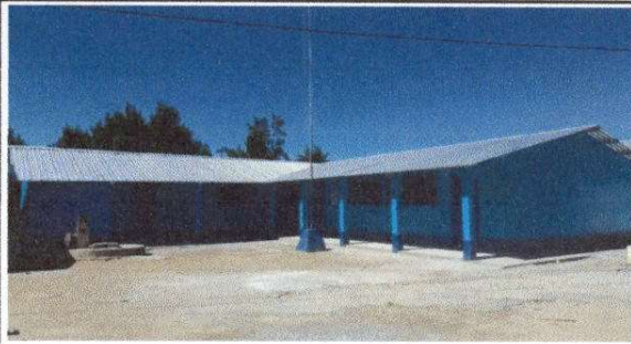
Foto 1: Sustitución de cubierta de lámina por lámina troquelada aluzinc calibre 26